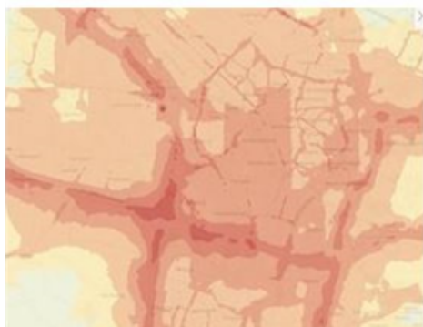
Utrecht op kaart Stikstofdioxide (NO 2 ) 2018 (Leefomgeving)